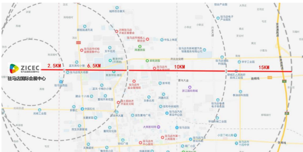
会展中心地理位置图

驻马店国际会展中心位于五峰山大道与开源大道交叉口西北侧, 距离市行政文化中心 6.5 公里、距驻马店高铁站约 2.5 公里、距驻马店京港澳高速 G4 京珠高速入口 14.7 公里。